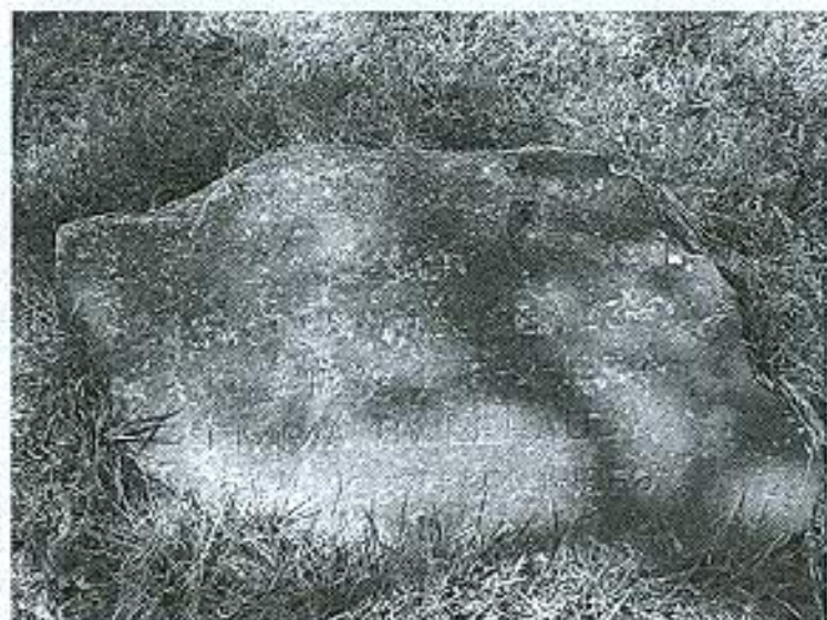
Gravsteinen like sør for kirkeveggen på Austmarka. Som det framgår av bildet, trengs det oppfrisking av skriften.