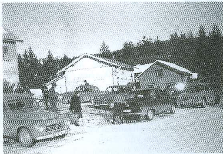
Mange svensker reiste over grensa for å handle på allehelgensdagen.