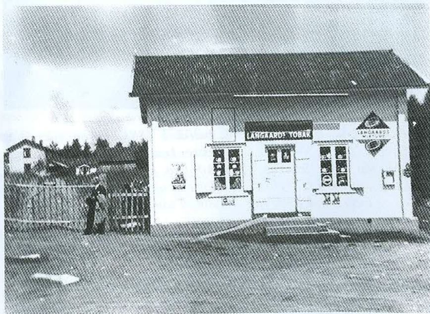
Denne forretningen var i drift fra 1907 til 1956.