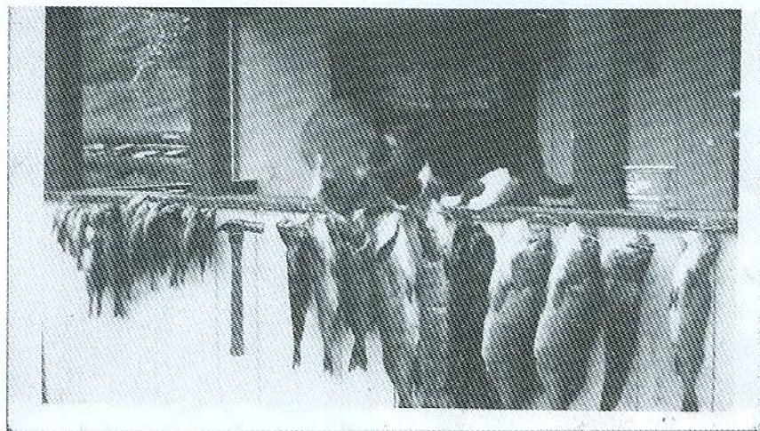
I Søndre Hærstjøen er det mye stor abbor. Hammeren som henger blant fiskene gir en pekepinn på størrelsen.

Heimbaka brød, en selvfølge, ble oppbevart i ei kasse av tre i kjelleren slik at ferske brød var sjelden vare, og at "kjøpbrød" smakte fortreffelig er vel forståelig.