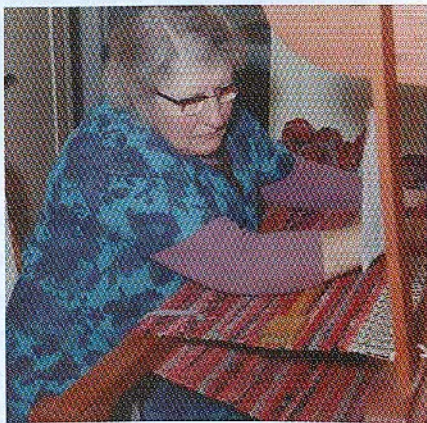
Mor vever filleryer. Denne rya blir fortsatt brukt heime i Tomta.

Har traumer når det kommer til det å rake og medfølgende vannblemmer. Det skulle ikke ligge igjen et strå etter slått og spesielt "skrabbslått". Mellom stubber og steiner, under busker og kjerr og det måtte gå fort, for jeg husker pappa sa: Nå blir det svart i Kjensliroa, underforstått regn og torden, og at nå haster det.